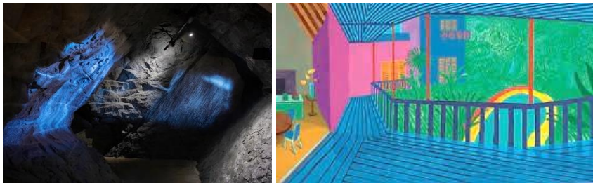
Gletschergarten Luzern: Felsenwelt (Bild: NZZ) / David Hockney (Kunstmuseum Luzern)