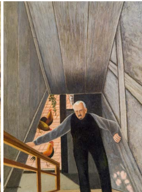
Vater auf der Treppe, 1956